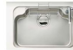
スペースアップシンク