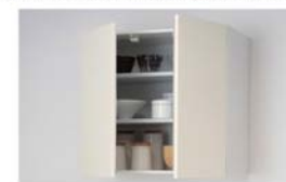
ミドルウォールキャビネット