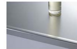
ステンレスカウンター/銀河エンボス