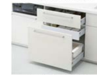
2段引き出し(内引き出し付き)