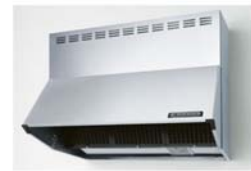
シロココファンフードシルバー