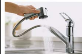
マイクロソフトシャワー水栓(ハンドシャワー)